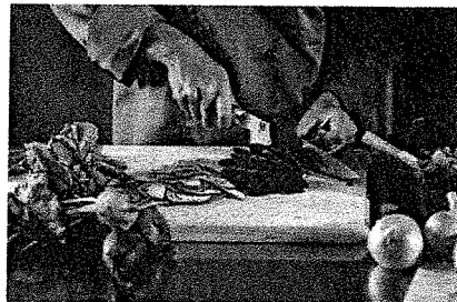
LABEL FAIT MAISON

Voilà six mois que la Fédération romande des consommateurs (FRC), GastroSuisse, Slow Food Suisse et La Semaine suisse du Goût ont lancé le label «Fait Maison» en Suisse romande. Les chiffres sont très encourageants: déjà 220 demandes d'affiliation enregistrées et 105 restaurants labellisés à ce jour. Le label a donc déjà atteint 74% de son objectif initial, qui était de 300 restaurants. Pour fêter ça, une action spéciale a été mise en place. Le vendredi 9 mars à midi, plus de 50 restaurants labellisés proposeront un menu 100% fait maison, avec entrée, plat et dessert, pour un prix spécial de 18 francs. La liste des restaurants partenaires de cet anniversaire se trouve sur la page Facebook du Label Fait Maison. Toutes les informations concernant la labellisation pour les établissements intéressés, ainsi que la liste des restaurants labellisés ou en cours d'affiliation est actualisée en continu sur: www.labelfaitmaison.ch