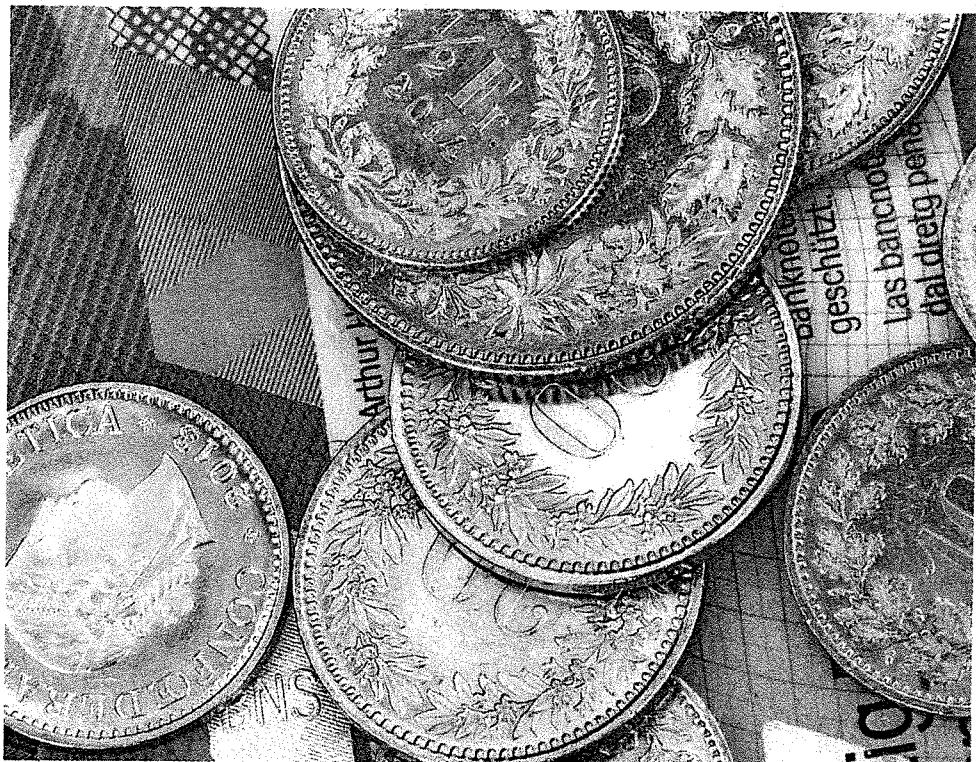
des établissements suisses ne peuvent se le permettre.