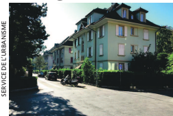
SERVICE DE LAUSANNE

La première étape de révision du recensement architectural de Lausanne a démarré le 14 mai dernier. Gérée par le Canton de Vaud, cette démarche revêt une grande importance pour la Ville, très active dans la préservation de son patrimoine bâti. Une fois mis à jour, le recensement architectural constituera un précieux outil pour la Ville dans sa volonté de planifier son développement avec une meilleure prise en compte du patrimoine bâti et de la singularité de chacun de ses quartiers. De nouveaux objets ou ensembles bâtis seront intégrés.